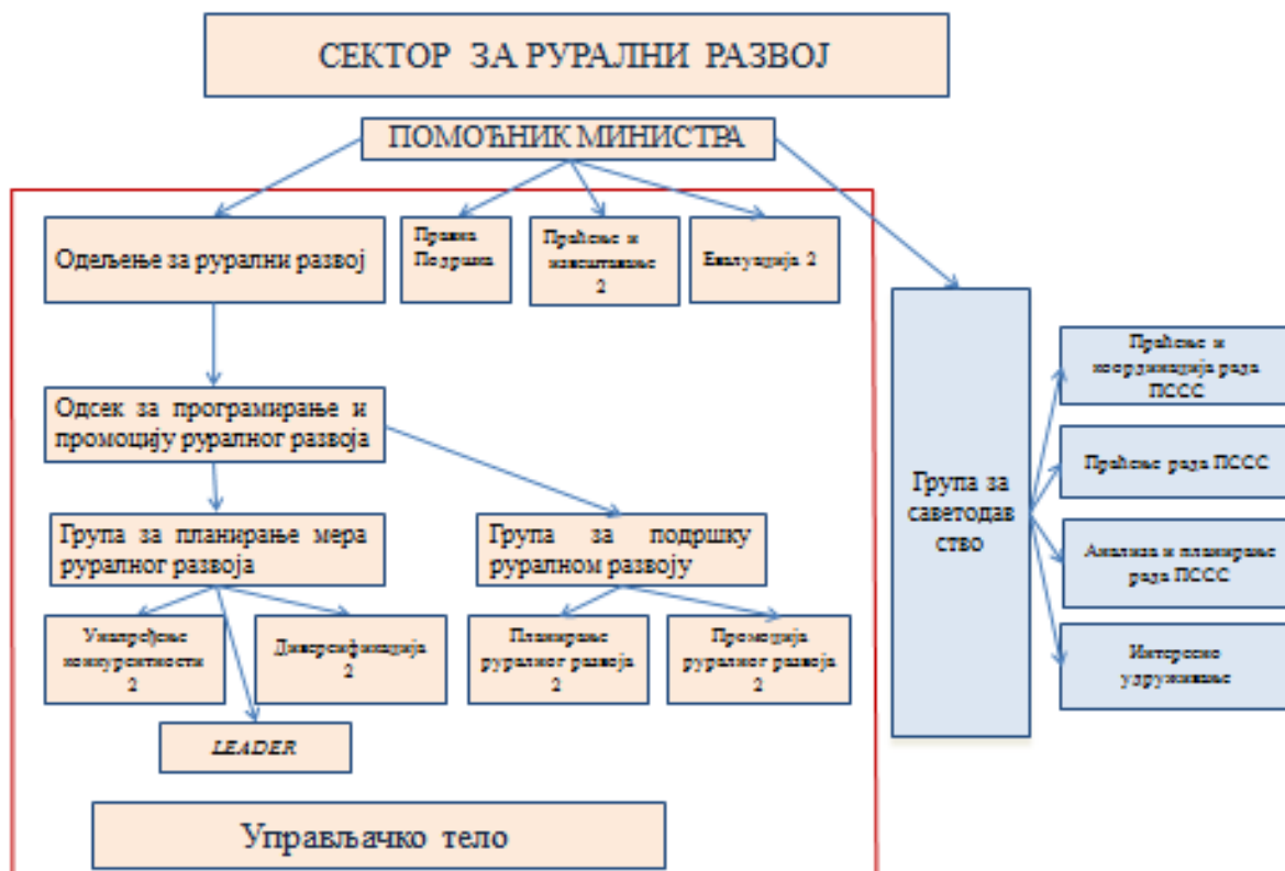
Графикон 2: Организациона шема УТ

(12) уколико УТ део својих задужења делегира другом телу, оно ће и даље бити у потпуности одговорно за управљање и спровођење ових задужења, у складу са принципом здравог финансијског управљања.