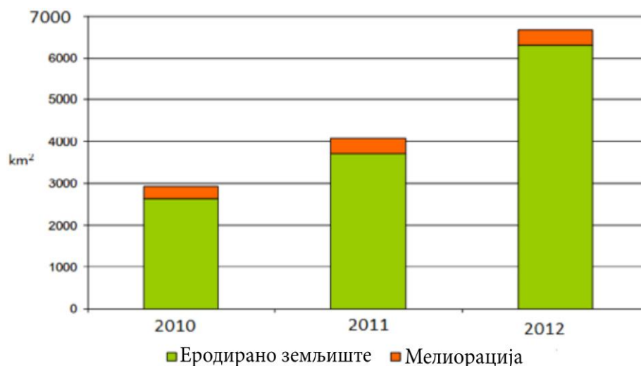
Графикон 1: Еродирано земљиште и мелиорација

Осетљиве и угрожене зоне према директиви UWWT и НД још увек нису обележене у Републици Србији. Тренутно на пројекту обележавања тих зона ради шведска Агенција за заштиту животне средине, а завршетак пројекта се очекује у априлу 2016. године.